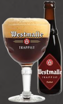
Westmalle Dubbel 0,33 L | 7,0% 5,25