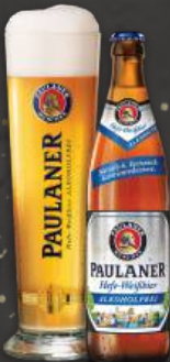
Paulaner Hefe-Weissbier 0,0 0,5 L | 0,0% 6,25