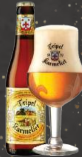
Tripel Karmeliet 0,33 L | 8,0% 5,50