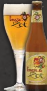
Brugse zot 0,33 L | 6,0% 5,25