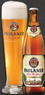
Paulaner Hefe-Weissbier 0,5 L | 5,5% 6,60