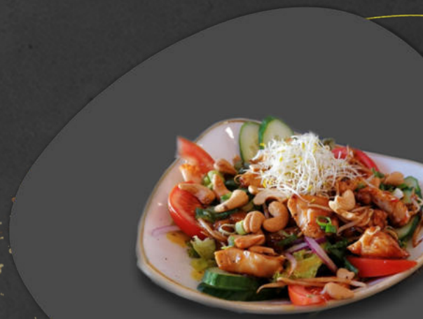
Salade kip Großer Salat mit Huhn

gebratene Hühnerstreifen mit gemischtem Salat aus Sojasprossen, Cashew Nüssen, Ananas und Chilisauce