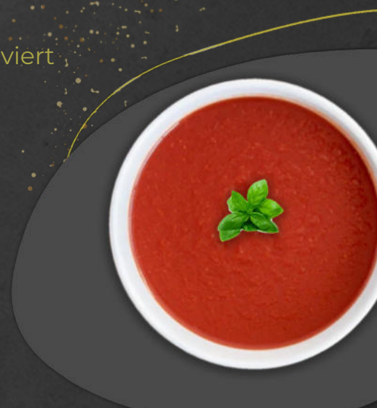
Huisgemaakte tomatensoep Hausgemachte Tomatensuppe

Frikandel, Kipnuggets oder gebratener Kabeljau serviert mit Pommes, Mayo und Apfelmus