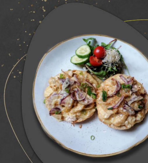
Broodje hete kip Brötchen Scharfes Huhn

Hühnerfilet, Chilisaucе, Sojakeimlinge, rote Zwiebeln und Käse